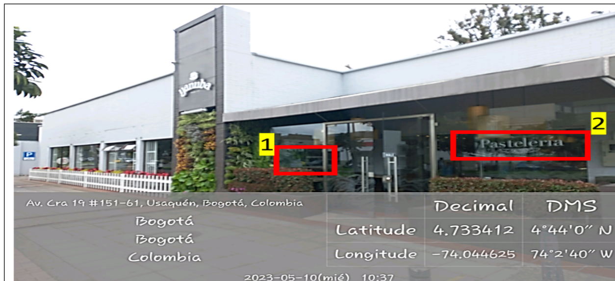
Fachada del establecimiento comercial denominado YANUVA AVENIDA 19, en la cual se evidencian dos (2) elementos publicitarios incorporados en las ventanas al costado derecho de la edificación identificados con los números 1 y 2